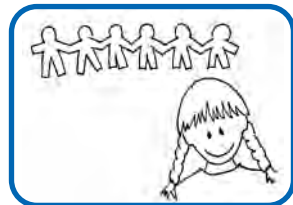
Wiederholt oft Laute, Silben oder bestimmte Tätigkeiten.