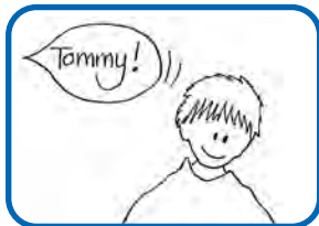
Wirkt wie taub.