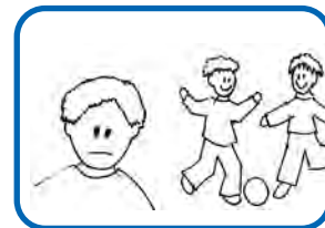
Zieht sich zurück/spielt oft alleine.