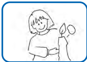
Zeigt keine Angst vor realen Gefahren.